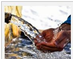
Calidad del Agua