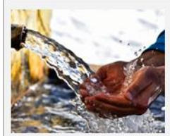
Calidad del Agua

Incluir criterios de salud pública en la gestión integrada de las cuencas hidrográficas y promover la utilización de soluciones basadas en la naturaleza